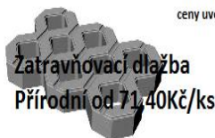
Zatravnovací dlažba Přírodní od 71,40Kč/ks