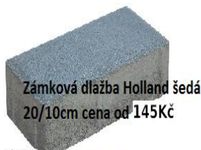
Zámková dlažba Holland šedá 20/10cm cena od 145Kč