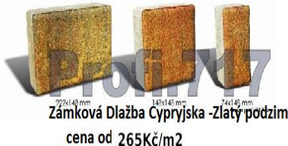
220x148 mm 140x145 mm 74x145 mm Zámková Dlažba Cyprijska - Zlatý podzim cena od 265Kč/m2

Máme také eshop přímo specializovaný pro oplocení : www.plot.717.cz