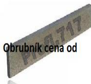
Obrubník cena od