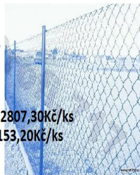
Sloupky PVC od 153,20Kč/ks

Výhoda je že nakupujete přímo s pohodlí domova.