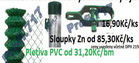
Pletiva PVC od 31,20Kč/bm

možnost dle vašeho výběru barvy i jiné se vzorníku Ral.